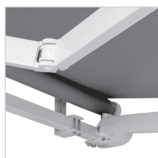
Dettaglio bracci Maxi